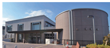
宝塚市立中央公民館