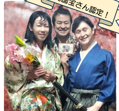
となりの人間国宝さん認定!