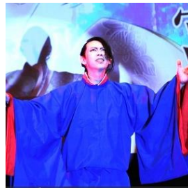
東公民館ホールでの公演より